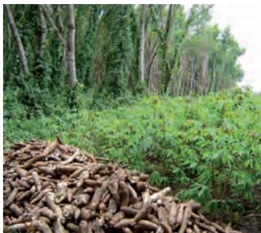
Mampu, on the savannahs of the Bateke plateau. A plantation of Acacia auriculiformis aged about twenty years (background). Harvest of cassava that was grown after the slashing and burning of an acacia parcel (front scene).