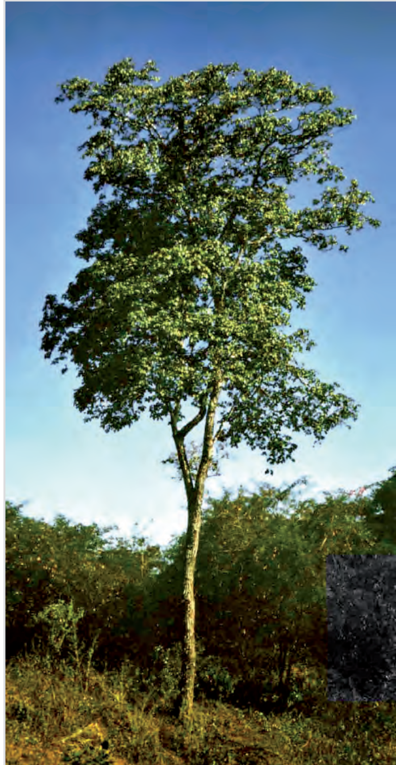
Photo 2. Tabebuia billbergii Standl., dans la région d'Arenillas (Équateur).