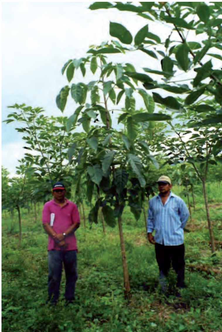
Photo 3. Tabebuia rosea A.P.D.C. (guayacán ou roble de Guayaquil). Jeunes plantations de 4 ans sur sols périodiquement inondés (Équateur).

Il s'avère que, par le passé, les arbres du genre Tabebuia semblaient être commercialement peu connus, du fait de leurs variabilité ; mais aussi parce que leurs noms locaux souvent basés sur l'aspect de leur écorce (ipé signifie écorce en langue guarani) pouvaient aussi désigner des arbres appartenant à d'autres familles botaniques. Ainsi le nom tauari (ou tahuari) désigne-t-il des arbres dont la partie interne de l'écorce, légèrement battue, se délite en feuilles très minces (utilisables pour rouler des cigarettes). Il s'applique à des espèces de Tabebuia comme à des espèces des genres Couratari , Eschweilera et Lecythis de la famille des Lécythidacées. De même, le nom de pau d'arco est donné à des espèces de Tabebuia ainsi qu'à des espèces des genres Dipteryx et Platymiscium de la famille des Fabacées.