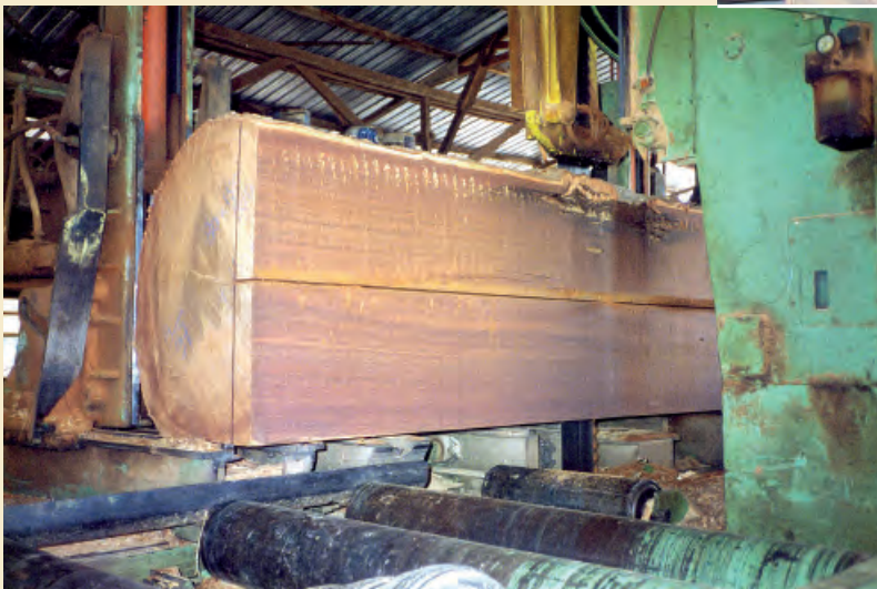
Photos 1. Sciage d'une grume de Tabebuia serratifolia en Guyane et colis de débits d'ipé certifié FSC (Forest Stewardship Council) au port de Nantes.